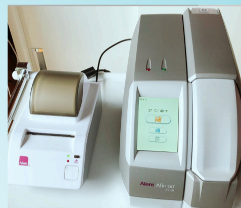
血液分析装置 Alere アリーア

日時：7月30日(月) 16時~21時 会場：アジャ アーバンアリーナ(AUA) 4階特設ブース 住所：浦添市勢理客4丁目19-7